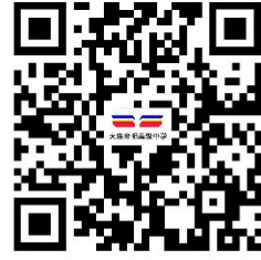
违规禁办事项清单