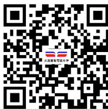
12.代收代支收费（现场办）