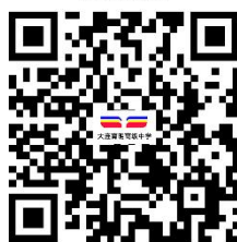
12.代收代支收费（掌上办）